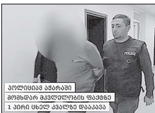
პოლიციამ აპარატი მომხდარ მკვლელობის ფაქტზე 1 პირი სხელ კვალები დააპაპა

შინაგან საქმეთა სამინისტროს მიერ ჩატარებული გამოძიებით დადგინდა, რომ 11 დეკემბერს, ხელგაჩაურის მუნიციპალიტეტის სოფელ სალიბაურში, ურთიერთშელაპარაკების ნიადაგზე წარმოშობილი კონფლიქტის დროს, ბრალდებულმა, მასზე რეგისტრირებული სანადირო თოფიდან რძალს ესროლა, რომელიც მიყენებული დაზიანების შედეგად ადგილზე გარდაიცვალა. გა-