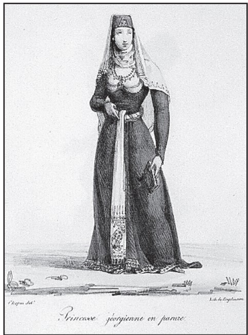
„Princesse géorgienne en parure“

ვისი ცხოვრება საქართველოს დაუკავშირა. იგი თვ. მოდერნიზატორის (გერმანელი მწერალი, რომელიც 1844 წელს ჩამოვიდა საქართველოში, თბილისის გიმნაზიაში ასწავლიდა ფრანგულ ენას, მოიარა საქართველო და თავისი შთაბეჭდილებები გამოაქვეყნა გერმანიაში) რჩევით დაინტერესდა საქართველოში. მან თარგმნა გერმანულ ენაზე „ვეფხისტყაოსანი“ და გამოაქვეყნა დრეზდენსა და ლაიფციგში. მისი ნაშრომი „ქართველი ხალხი“ მრავალ ევროპულ ენაზე ითარგმნა. მას ახლო ურთიერთობა ჰქონდა ი. ჭავჭავაძესთან, ი. მაჩაბელთან და სხვა გამოჩენილ ქართველ მოღვაწეებთან. იგი 1892 წლიდან საქართველოში დამკვიდრდა და 1927 წელს აქვე გარდაიცვალა.