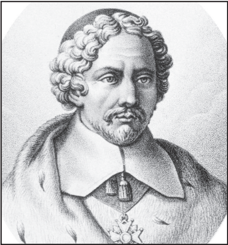
ჟოჯა აიბონ და ბურნაფორი.