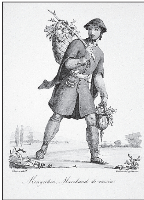
„Mingrelian, Marchand de poisson“