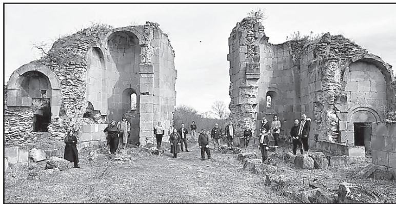
ციელგებულ მნიშვნელოვანი არქეოლოგიური აღმოჩენების შესახებ ინფორმაცია მიიწოდეს.

ნაქალაქიანი, რომელსაც კო-ფინანსირება მიიღო, გახდა საქართველოში ერთ-ერთი ყველაზე მიმდინარე ტურისტული ადგილი, – სწორედ ამ მიზნით, საგარეო ურთიერთობების განყოფილება „მოძრაობა კულტურული მემკვიდრეობისთვის“ დაიწყო საინფორმაციო კამპანია – „ახალი სიცოცხლე სამშვილდეს“.